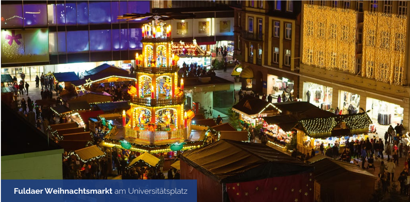
Fuldaer Weihnachtsmarkt am Universitätsplatz